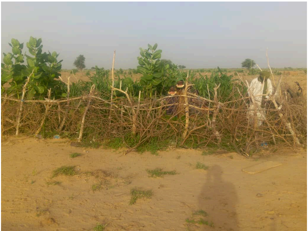
Cet été à Tagoudoum